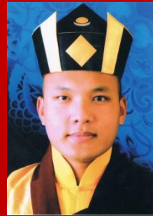
S.H. der 17. Karmapa Ogyen Trinley Dorje